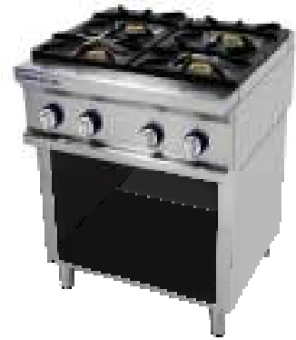
CG-740/M-LC + S-87